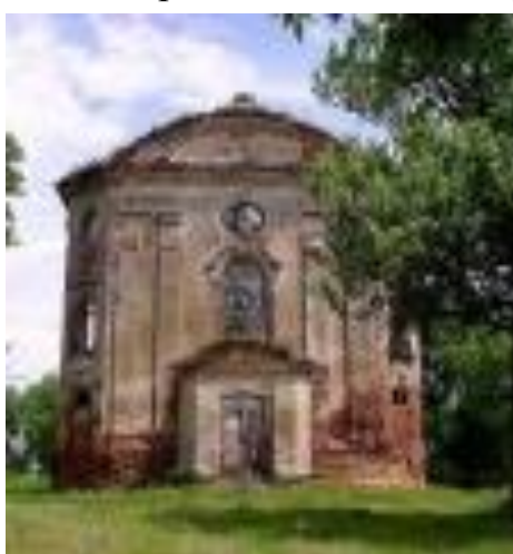
Фот.13 Троицкий костёл Начало 2000г