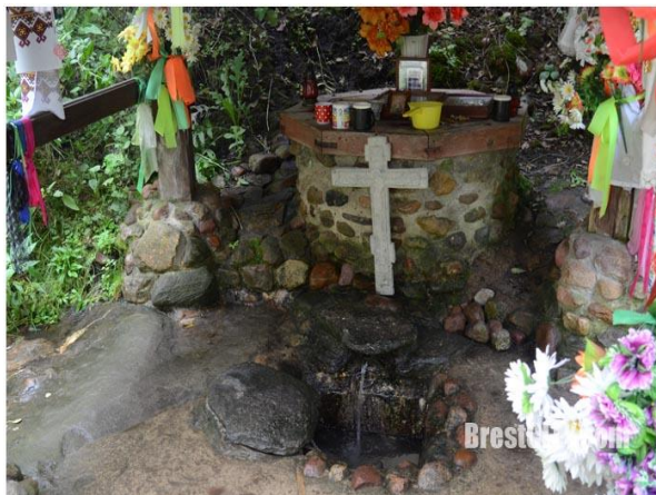
Фот.16 Свято-михайловский родник

забыли про этот камень. Перед открытием родника жительница деревни Орля вспомнила о святом камне, о котором узнала от своей прабабушки. Прихожане местного храма решили найти его. Они долго искали этот камень, так как время сделало свое дело, и его занесло землей. Но все же нашли и откопали. Сейчас же, кто приходит к этому месту, считает своим долгом поклониться этой святыне, так как он приносит исцеление людям. На нем, если присмотреться, виден отпечаток посоха Матери Божьей и следы ее ступней. А также известны факты исцеления водой из чудодейственного родника.