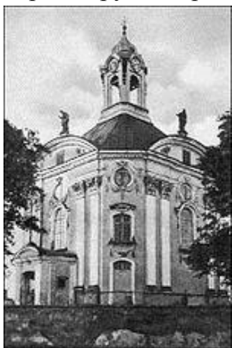
Фот.12 Троицкий костёл до 1939 г.

После восстания 1863-1864 гг. костёл в Волчине был сначала закрыт, а потом передан православным верующим. Работы по перестройке костела в церковь начались в 1873. 30 августа 1876 г. состоялось освящение церкви во имя Пресвятой Троицы. Свято-Троицкая церковь была приписана к волчинской церкви Св. Николая Чудотворца. За период существования церкви крупных ремонтов и переделок здания не проводилась.