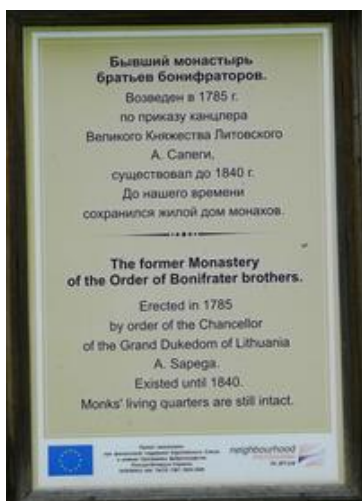
Фот.6 Информационная табличка у монастыря бонифраторов