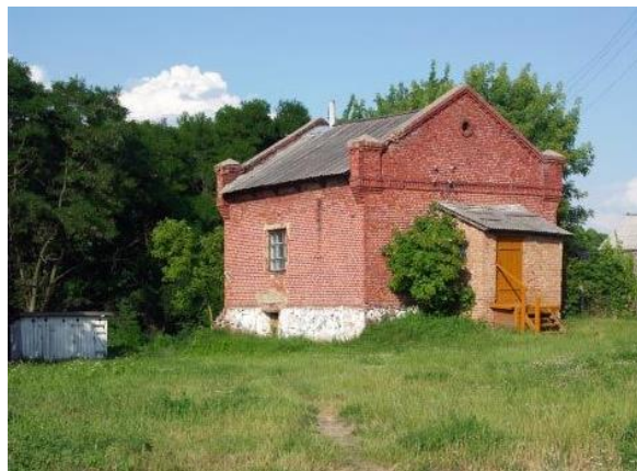
Фот.9,10 Хозяйственные постройки фольварка Александрия