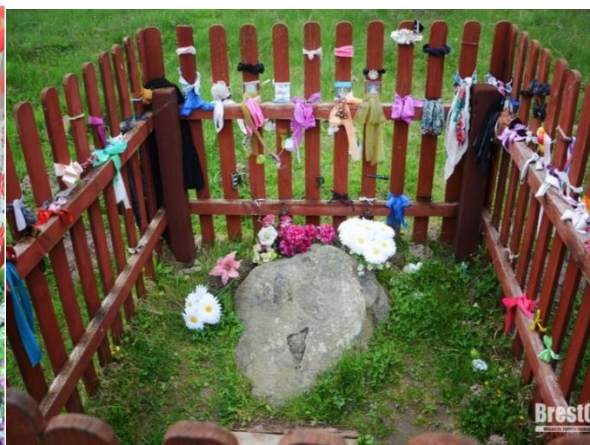
Фот.17 Камень с отпечатком ступни Божьей матери

9 октября 2005 года родник был освящен епископом Брестским и Кобринским Иоанном в честь архистратига Михаила.