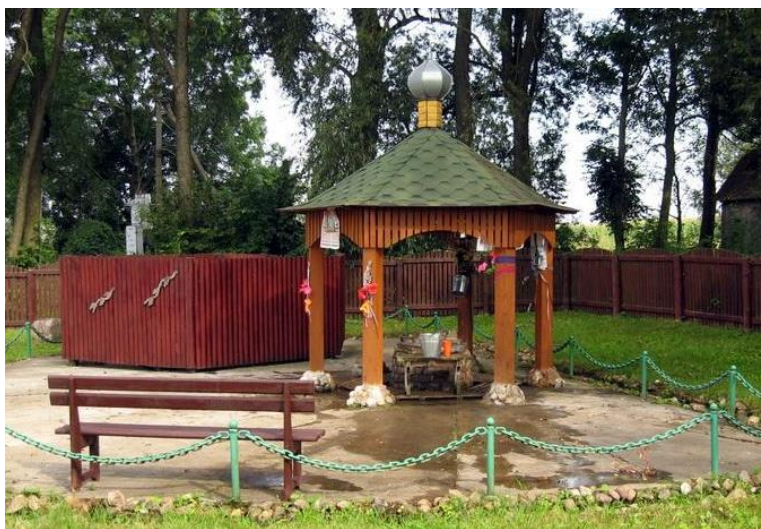
Фот.18 Родник д.Тумин

В глине содержатся практически все соли, необходимые нашему организму, легкоусвояемые макро- и микроэлементы. Глина – сильный адсорбент. Она поглощает жидкие и газообразные токсины, запахи, гной, газы, микробы. Она отлично обезвреживает яды.