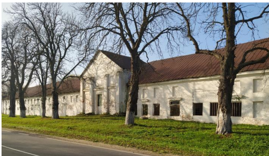
Фот.5 Монастырь бонифраторов

Бонифратры – монашеский орден Римско-католической церкви с многовековой традицией, основанный в середине XVI века в Гранаде (Испания) как продолжение харитативной деятельности св. Иоанна Божьего (1495–1550).