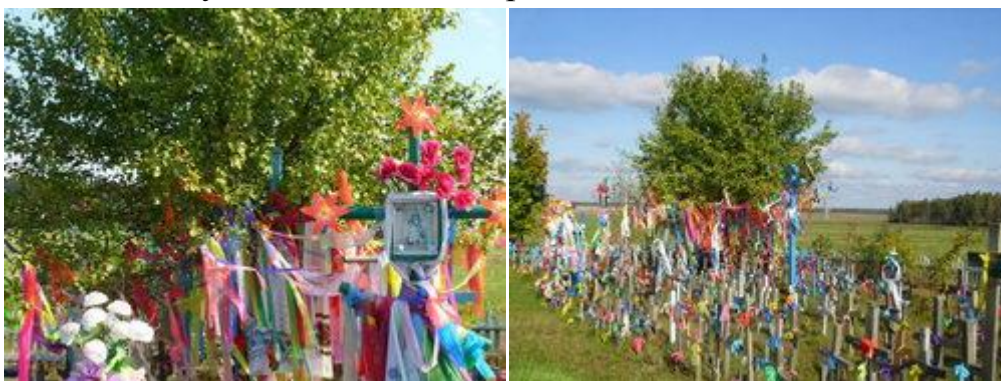
Фот.22,23 Святое место «Грушка», поклонные кресты

– Эту историю мне передала мама, а маме – ее отец, он при церкви прислуживал. Божия Матерь явилась здесь где-то в 1880-х годах. На этом пригорке, где растет груша, девочка-сирота из Бушмичей (деревня в 500 метрах от святого места - Ред.) пасла хозяйский скот. Она была слабовидящей. И нашла гроза. Девочка подошла к груше и стала плакать, мол, как я теперь скот соберу. И тут ей явилась женщина в белом и в солнечных лучах – Божия Матерь.