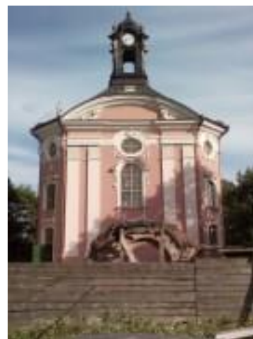
костёл после реконструкции

В 1918 г. Волчинский храм был возвращен католикам. В 1925 г. в храме отремонтирована штукатурка, сделана печка, укреплена конструкция башни, вставлены новые двери, оконные рамы, отремонтирована крыша. В 1930-е среди польского населения региона началась кампания по возрождению Свято-Троицкого храма. В храме хранилась метрика Станислава Августа Понятовского, родившегося в Волчине, – последнего короля Речи Посполитой. А в июле 1938 г. в Волчин из Ленинграда был перевезен гроб с останками короля Станислава Августа Понятовского. Перезахоронение проводилось тайно от общественности, без выполнения необходимого в таком случае ритуала. Вторая мировая война приостановила начавшийся ремонт костела.