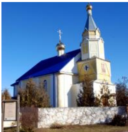
Фот.11 Николаевский храм д. Волчин

Внесен в список историко-культурных ценностей РБ (19 в.) В состав прихода входит кладбищенский Владимирский храм-часовня.