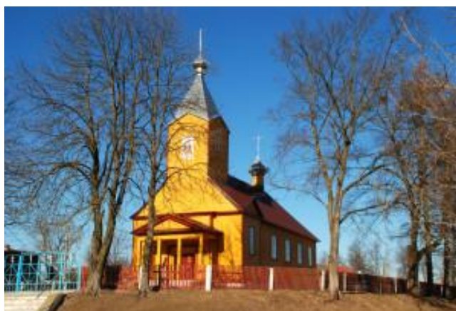
Фот. 21 Николаевская церковь д. Верховичи