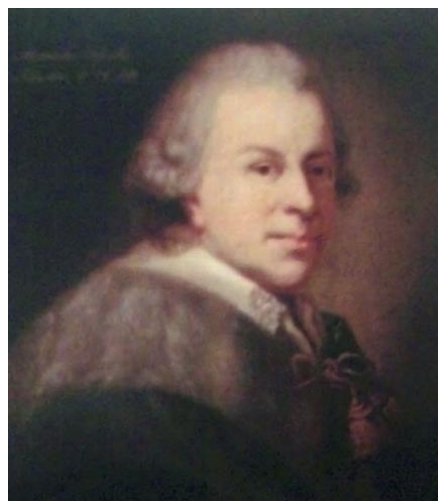
Фот.7 Александр Сапега